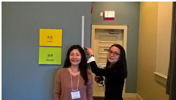
☺ ボランティア、座談会講師ともにありがとうございます！

皆様と勉強会でお会いできる事を楽しみにしております。また、介護でお困りの方がいらっしゃいましたらお知らせ下さい！