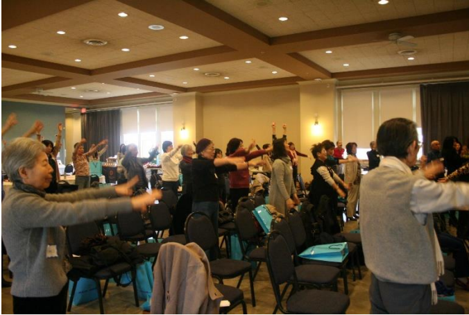
☺ お昼休憩後は参加者全員で腕ふり体操

ふり返れば4年前、何とかこのバンクーバーに保健ネットワークを作り、困った方があれば相談できる場所をつくりたいと思って以来、毎年企画してきたヘルスショーですが、本当に和がどんどん大きくなっていること、ありがたい限りです。来年も第4回ヘルスショーに向けて楽しい企画を考えていきますので、お楽しみにしてください。